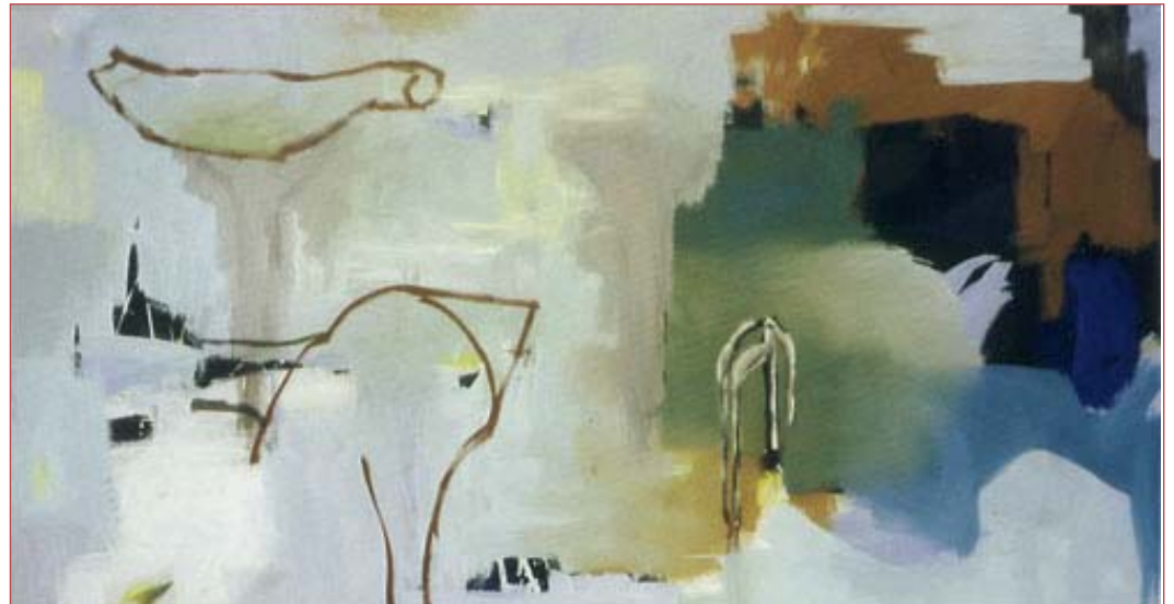
partly frozen 90 x160 cm acrylic on canvas, 1993