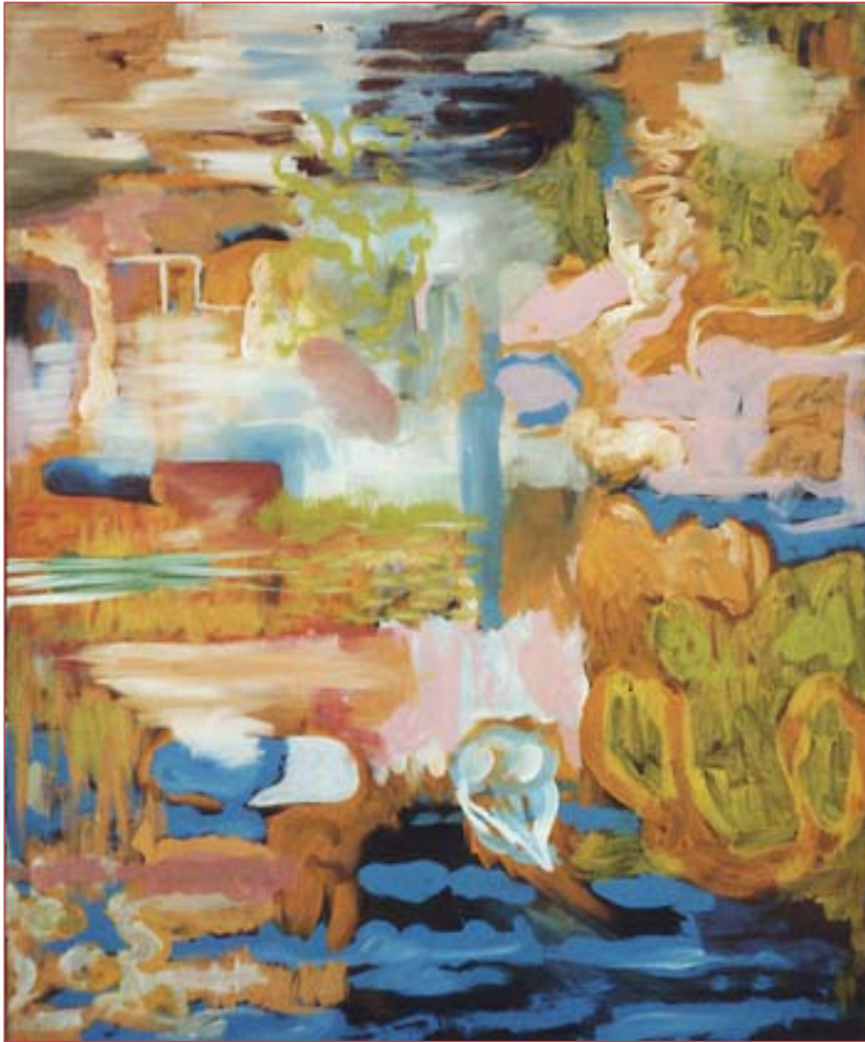
Ins Blaue 146 x120 cm Acryl auf Nessel, 2003