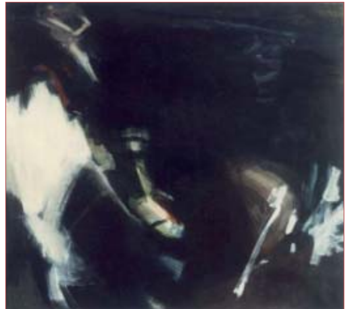
Ohne Titel 135 x150 cm Acryl auf Nessel, 1990