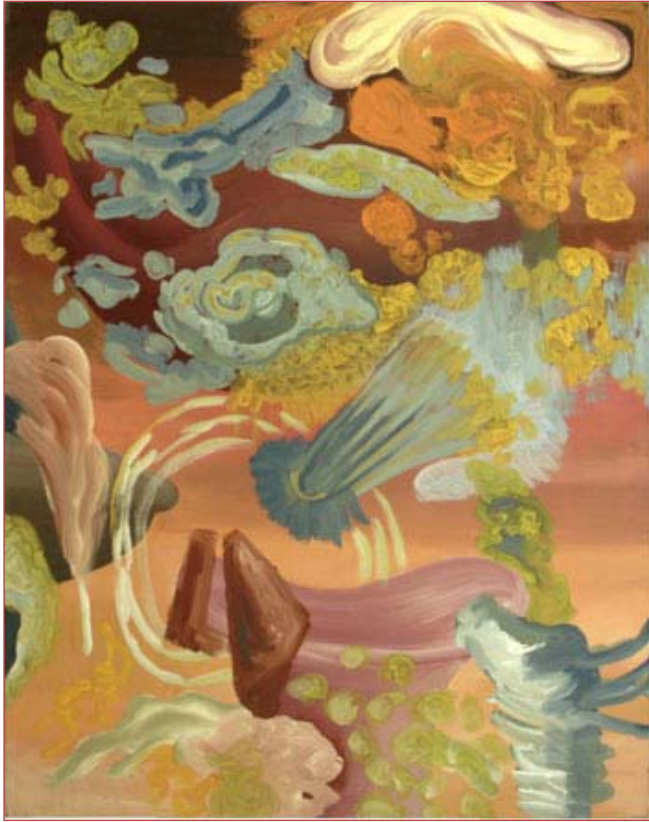
Little Big Bang 130 x 100 cm Acryl auf Nessel, 2003

Little Big Bang 130 x 100 cm acrylic on canvas, 2003