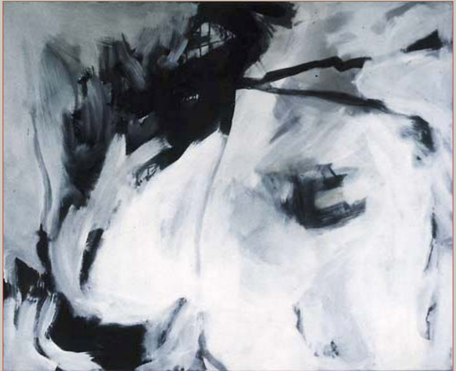
Ikarus 120 x 150 cm Acryl auf Nessel, 1989