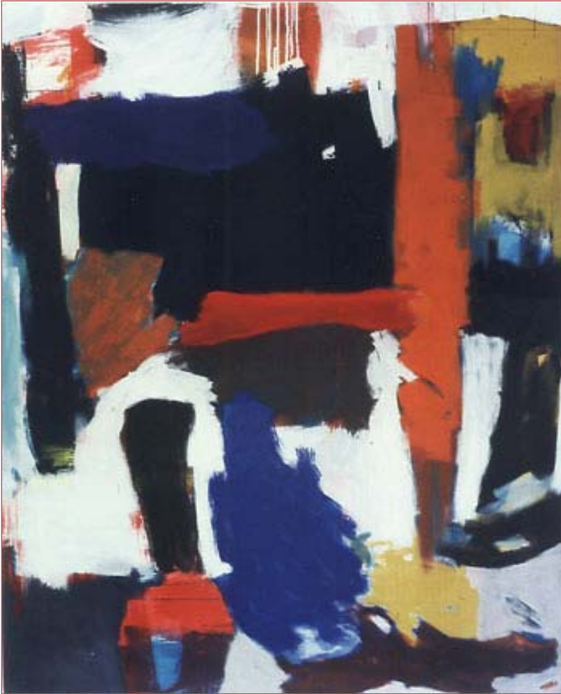
Ohren und Fahnen 169 x135 cm Acryl auf Nessel, 1989

ears and flags 169 x135 cm acrylic on canvas, 1989