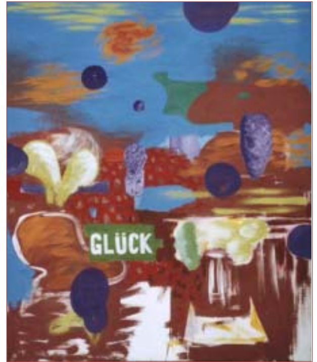
„Glück“ 120 x100 cm Acryl auf Nessel, 2003