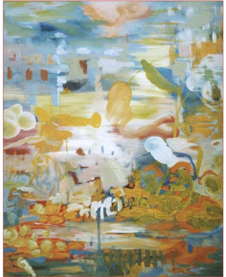
Finden und Verlieren 130 x 100 cm Acryl auf Nessel, 2003

Little Big Bang 130 x 100 cm acrylic on canvas, 2003