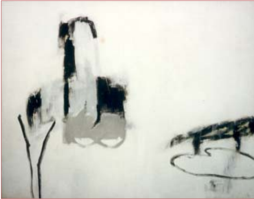
Ohne Titel 115 x150 cm Acryl auf Nessel, 1992