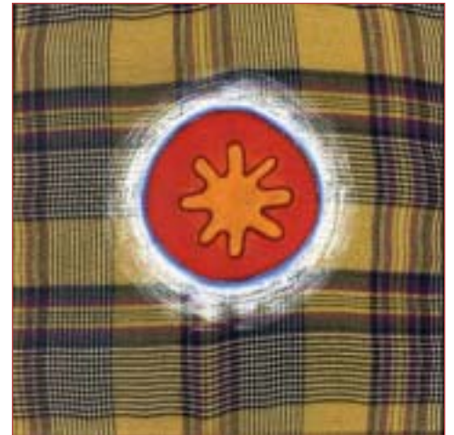
Aus der Serie Simple Pleasures 30 x 30 cm Acryl auf Baumwolle, 2003/04