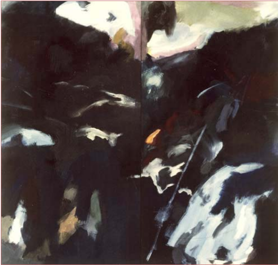
Schneesmelze 170 x180 cm Acryl auf Nessel, 1987 zweiteilig

snow melting 170 x180 cm acrylic on canvas, 1987 two parts