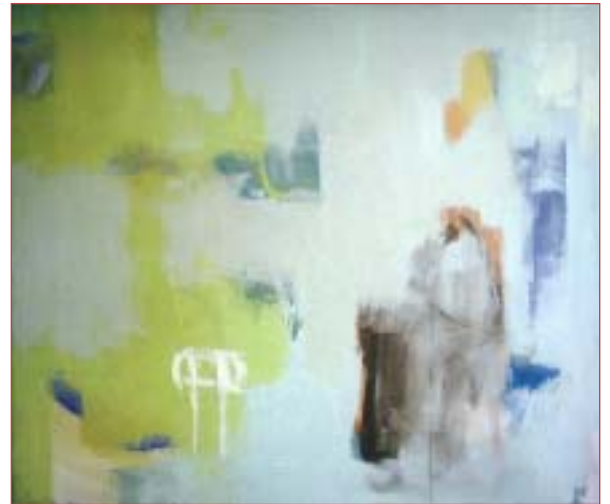
Im grünen Reich 70 x 80 cm Acryl auf Nessel, 1993

ears and flags 169 x135 cm acrylic on canvas, 1989