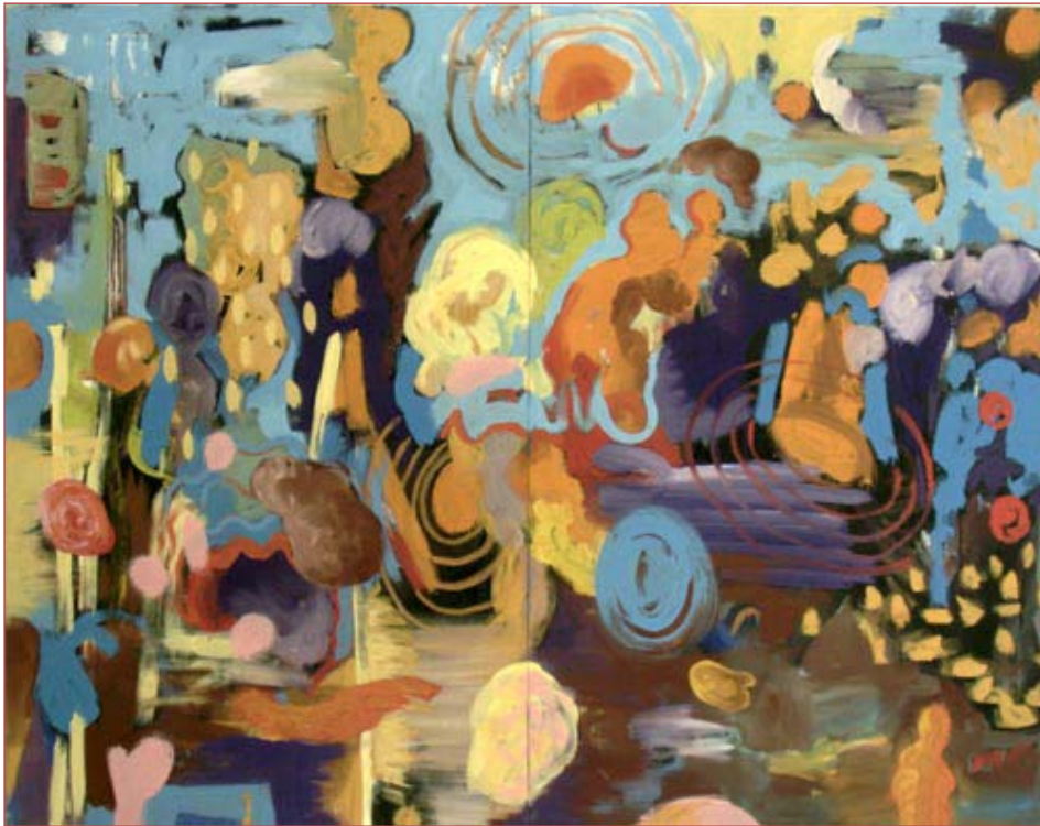
Aussäen 130 x160 cm Acryl auf Nessel, 2003 zweiteilig